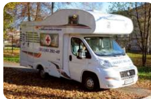
Передвижная мобильная амбулатория

Бригады узких специалистов выезжают в отдаленные ФАПы и амбулатории района для проведения консультаций по заранее составленному графику. За период 2025 года было совершено 35 выездов и осмотрено 577 пациентов.