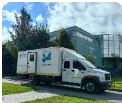
Передвижной мобильный ФАП