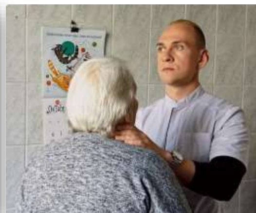
Специалисты на выездном медосмотре в амбулатории Тельмана