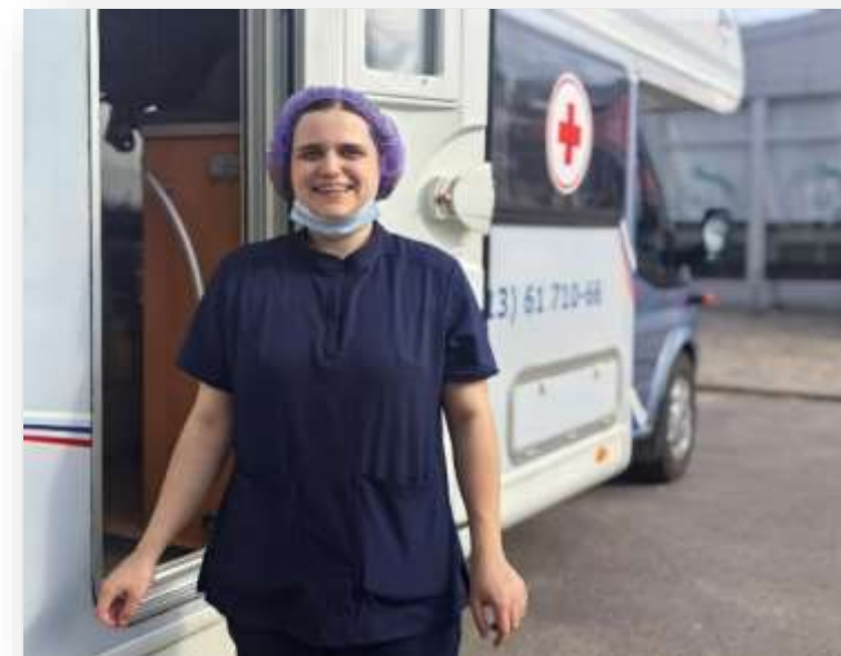
Мобильный пункт вакцинации в Тосно