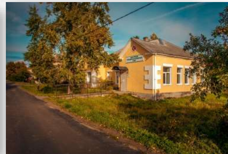
ФАП п. Рябово