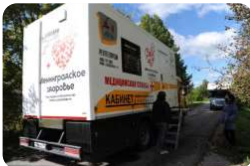
Передвижной мобильный флюорограф