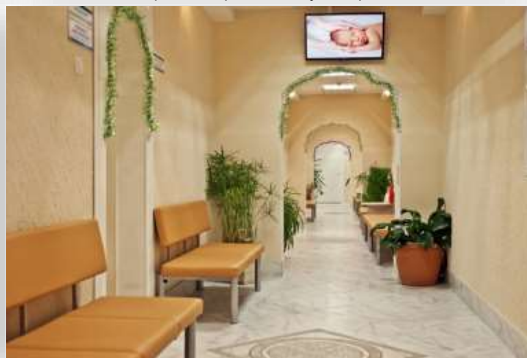
Женская консультация г. Тосно