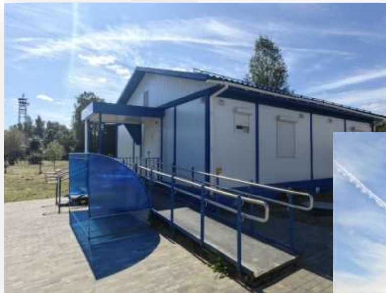
ФАП в поселке Любань