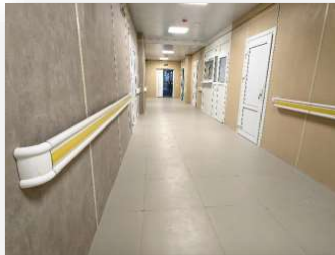
Будущее кардиологическое отделение стационара