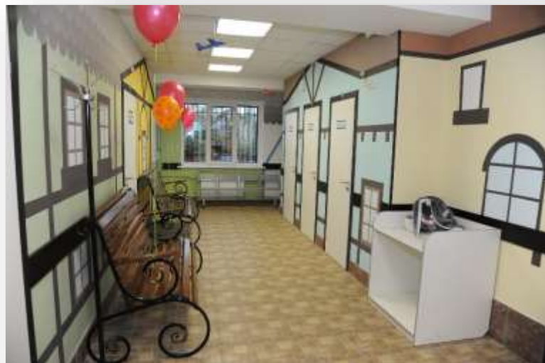
Педиатрическое отделение Любанской поликлиники