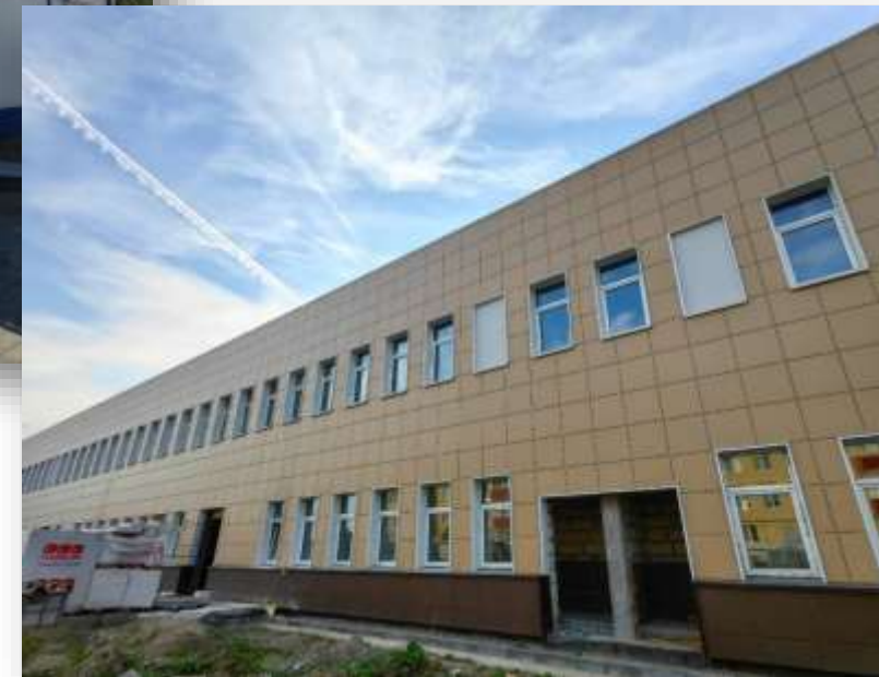
Амбулаторно-поликлинический комплекс в городе Тельмана